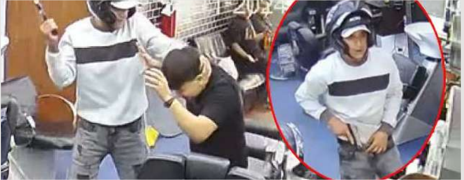
La inseguridad ciudadana, que campea en todo el país, al parecer, no es percibido por el presidente del Consejo de Ministros, que funge como abogado defensor de Boluarte.

voz de Dios”, el pueblo no se siente representado.