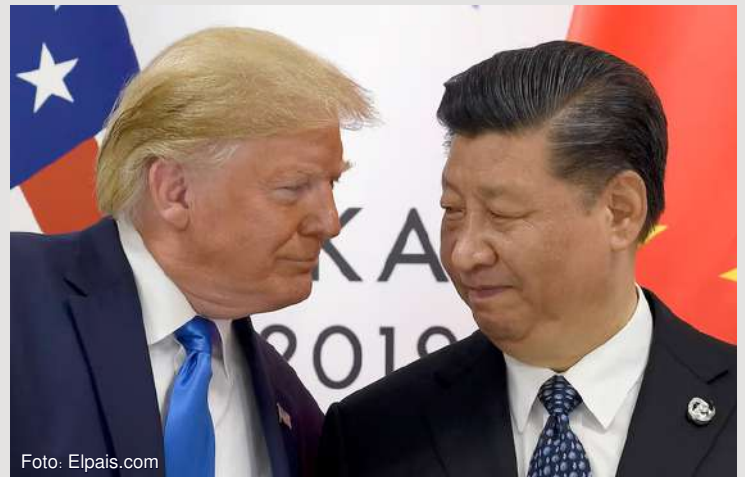
En unos años, el Perú se convertirá en el centro de la disputa comercial entre Estados Unidos y China.

El regreso de Trump al poder y la celebración de la APEC en Perú ocurren en un contexto global de incertidumbre.