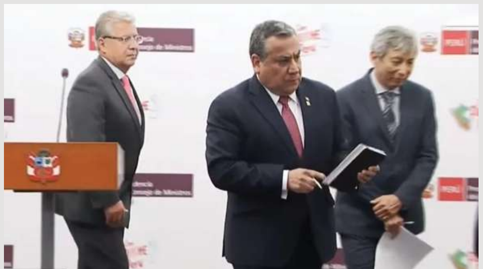
Los ministros de Boluarte han perdido el contacto con la realidad y por ello su desempeño es ampliamente criticado por la opinión pública. Las reuniones de APEC, sirvió como tregua.

*Consultor Político y secretario de la Sociedad Peruana de Consultores Político - SOPECOP