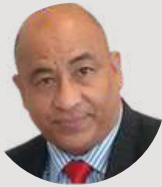
POR ROBERTO SOTO

E n el nuevo ecosistema político, improvisar es cavar la propia tumba. Las campañas electorales ya no son mítines, pancartas pancartas ni discursos encendidos. Hoy, se libran en varios frentes simultáneos: el emocional, el digital, el narrativo, el territorial y, sobre todo, el estratégico.