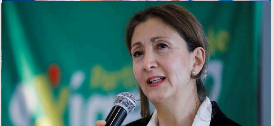
Fernando Villavicencio, en Ecuador, Miguel Uribe e Ingrid Betancourt, en Colombia; fueron blancos de los ataques en pleno proceso electoral. El primero de ellos murió, el segundo se encuentra grave y la tercera salió ileso.

En ese contexto, el Perú debe actuar ahora. No puede esperar a que un atentado de alto perfil marque su proceso electoral para recién tomar medidas. Urge reforzar la seguridad electoral, fiscalizar con mayor rigor el financiamiento de campañas y generar protocolos preventivos en zonas de riesgo.