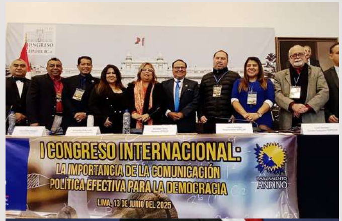
Luego de seis horas de ardua jornada, se clausuró el congreso con la presencia de todos los ponentes que se dieron cita en el evento.

Frente al ruido, el odio y la desinformación, la comunicación política efectiva se erige como un acto de responsabilidad y un ejercicio de ciudadanía.