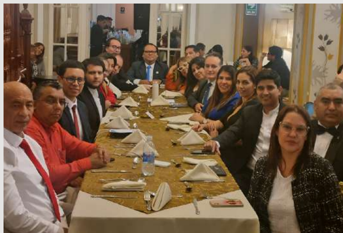
Como ya es una costumbre en la SOPECOP, luego de los trabajos, nos confundimos en un sano, ameno y alegre compartir.